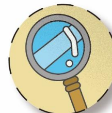
持續追蹤學童學習狀況